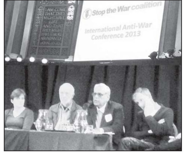
கட்சிகள், ஏகாதிபத்திய எதிர்ப்பு அமைப்புகள் மற்றும் சக்திகளோடு கலந்து பேசி அதற்கான முன்முயற்சி எடுத்தோம்.

பல்வேறு நாடுகளில் நடைபெறும் இத்தகைய இயக்கங்கள் சரியாக ஒருங்கிணைக்கப்பட்டு ஒன்றிணைக்கப்பட்டால், ஏகாதிபத்தியப் போர் நடவடிக்கைகளுக்கு எதிரான சரியாகப் போராடுவதற்கான வலிமையான உலகளாவிய ஏகாதிபத்திய-எதிர்ப்பு உக்கிரமான அமைதி இயக்கத்தினை கட்டியெழுப்பமுடியும் என்று நாங்கள் கருதுகிறோம். அதன்படி இதனை முன்னெடுத்துச் செல்லும் பொருட்டு பெல்ஜியம் கம்யூனிஸ்ட் கட்சி (CPB) உள்பட நாங்கள் தொடர்பு வைத்துள்ள அனைத்து கட்சிகளையும் நாங்கள் அணுகினோம். ஆனால் (CPB) தனது இயலாமையைத் தெரிவித்துவிட்டது. அதனால், இந்தப் பொறுப்பை நாங்கள் ஏற்றுக் கொள்ள வேண்டியதாயிற்று நாங்கள் மற்ற சகோதர