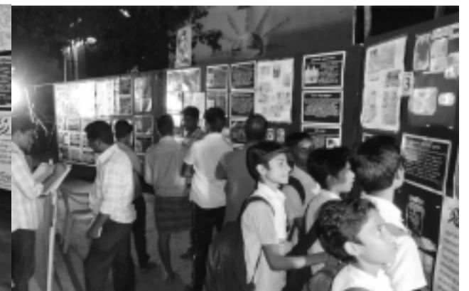
தேனியில் ஜனவரி 31 அன்று நடைபெற்ற நேதாஜி அவர்களின் புகைப்பட மேற்கோள் கண்காட்சி