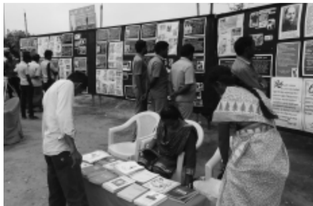
மதுரை மாவட்டம் உசிலம்பட்டியில் ஜனவரி 27 அன்று நடைபெற்ற நேதாஜி அவர்களின் புகைப்பட மேற்கோள் கண்காட்சி