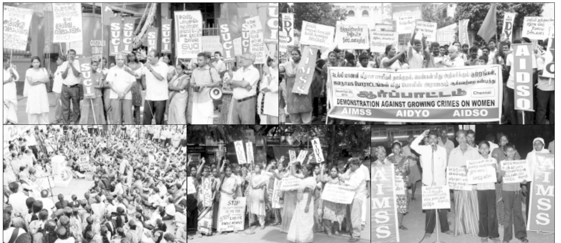
டெல்லி மாணவி மீதான பாலியல் பலாத்காரத்தைக் கண்டித்து எஸ்யுசிஐ(சி) மற்றும் அதன் வெகுஜன அமைப்புகளான ஏஜஎம்எஸ்எஸ், ஏஜடிஓஓ, ஏஜடிஎஸ்ஓ பல்வேறு மாநிலங்களில் கண்டன இயக்கங்களை நடத்தியது. (இடமிருந்து வலம்) : கேரளா, சென்னை, பெங்களூர், மதுரை, நெய்வேலி

சோசலிஸ்ட் யூனிட் சென்டர் ஆஃப் இந்தியா, தமிழ்நாடு மாநில அமைப்புக் கமிட்டிக்காக, அச்சிட்ட - வெளியிடுபவர்: வி.பி.நந்தகுமார். அலுவலகம் : பு.எண். 16 (ப.எண். 18), இராட்டலர் தெரு குளை, சென்னை 600 112, அச்சகம் : அய்யனார் ஆப்செட், நெ.10, சுப்பிராப் நகர், குளமேடு, சென்னை 600 094. ஆசிரியர் : வி.பி.நந்தகுமார்