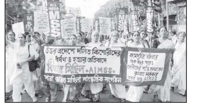
பெண்களுக்கு எதிரான குற்றங்களைக் கண்டித்து கொல்கத்தாவில் பேரணி

2012 டிசம்பரில் டெல்லியில் நிர்வாயிற்கு நேர்ந்த கொடுமை நாடு முழுவதிலுமுள்ள மக்களின் மனசாட்சியைத் தட்டி எழுப்பியது. மக்கள், குறிப்பாக இளைஞர்களும் பெண்களும் நல்லெண்ணம் படைத்த அறிவுஜீவிகளும் அணி அணியாய்த் திரண்டு வீதிகளில் குதித்தனர். இத்தகைய குற்றங்களுக்கு முற்றுப்புள்ளி வைக்க மத்திய, மாநில அரசாங்கங்கள் முழுமனதோடு உறுதியான