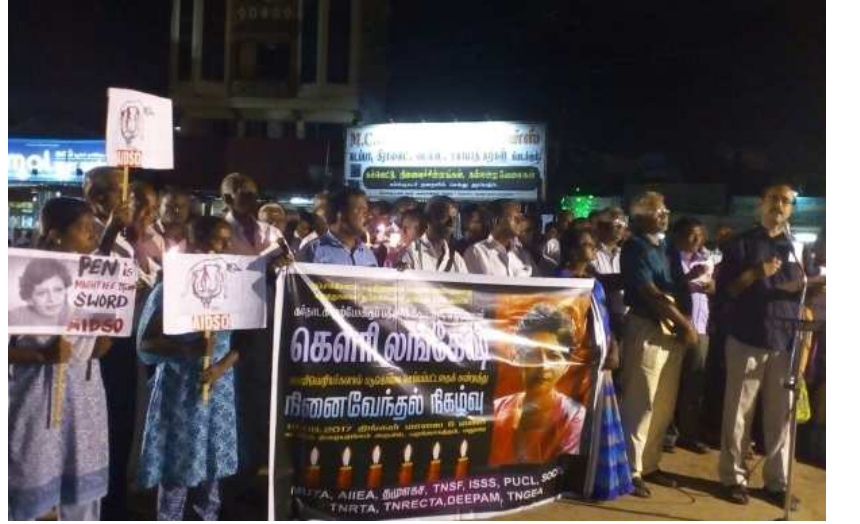
மதுரையில் நடைபெற்ற கௌரி லங்கேஷின் நினைவேந்தல் நிகழ்ச்சி

இக் கோரக்கொலை குறித்து மத்திய, மாநில அரசாங்கங்கள் உடனடியாக விசாரணை மேற்கொண்டு குற்றவாளிகளைக் கைது செய்வதுடன் அவர்களுக்குக் கடுமையான தண்டனையும் வழங்க வேண்டுமென நாங்கள் கோருகின்றோம். நல்லெண்ணம் கொண்ட மக்கள் யாவரும் இத்தகைய மதவாத, கொலைபாதக, கொடிய அரசியலுக்கெதிராக நாடு தழுவிய எதிர்ப்புப் போராட்டத்தை முன்னெடுத்திட வேண்டுமெனவும் அறைகூவல் விடுக்கிறோம் ■