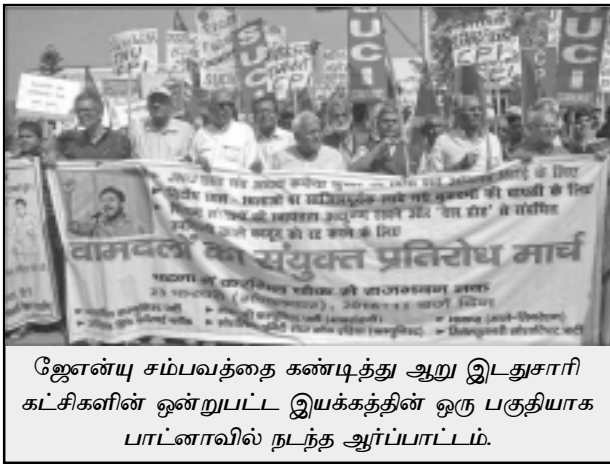
ஜேஎன்யு சம்பவத்தை கண்டித்து ஆறு இடதுசாரி கட்சிகளின் ஒன்றுபட்ட இயக்கத்தின் ஒரு பகுதியாக பாட்டினாவில் நடந்த ஆர்ப்பாட்டம்.

ஆளும் முதலாளித்துவ வர்க்கத்தின் ஆதரவோடு ஆர்எஸ்எஸ்-பாஜக-ஏபிவிபிபிஎன் எழுப்ப முயற்சித்துவருவது தேசியவாதமோ தேசபக்தியோ அல்ல அது தேச வெறிவாதம். தாய்நாட்டின் மீது மக்களிடமிருக்கும் தேசபக்தி உணர்வைப் பயன்படுத்திக்கொள்ளும் யுக்தியைத் சந்தர்ப்பவாத பிற்போக்கு பாசிஸ்டுகள் மேற்கொள்கின்றனர். அதன்பின்னர் நாட்டின் ஒருமைப்பாட்டைக் காக்கிறோம், அன்னிய ஊடுருவலை தடுக்கிறோம் என்ற பெயரில் சர்வாதிகார அரசின் கீழ் அனைத்து அதிகாரங்களையும் குவித்து நிலைநிறுத்துகின்றனர். அதிகாரக் குவிதல் நடக்கும்போது, பாசிசத்தின் கோரப்பற்களும் தூடையும் உருவாகி உருப்பெற்று விடும் அதன்பின்னர் அத்த களிப்போடு உக்கிரமான ஈவிரக்கமற்ற அடக்குமுறை ஏவப்படும். இதுதான் ஆளும் ஏகபோகங்களின் நீண்ட நாள் இலக்காக இருந்துவருகிறது, அதை பாஜக மற்றும் காங்கிரஸ் மூலமாக செயல்படுத்த அவர்கள் முயற்சிக்கின்றனர்.