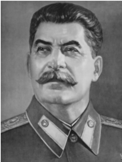
21 டிச, 1879 – 5 மார்ச், 1953