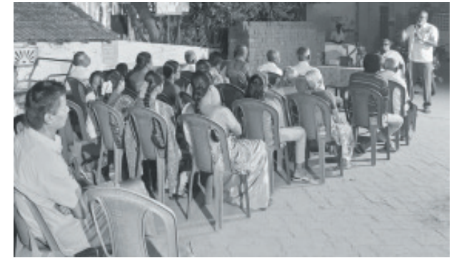
திருத்தங்கல், விருதுநகர் மாவட்டம்