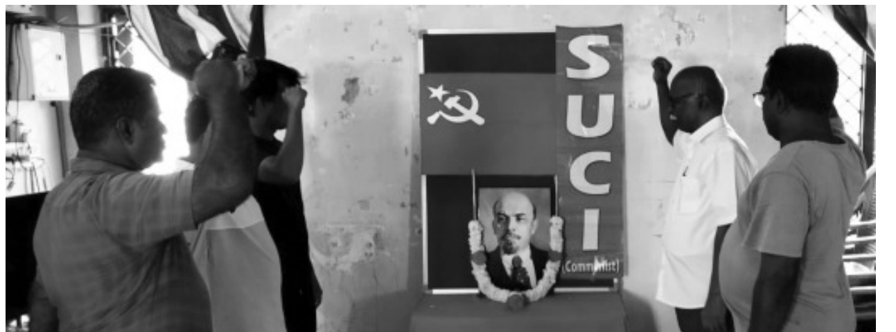
சென்னையில் மாநிலச் செயலாளர் தோழர் ஆ ரெங்கசாமி செவ்வணக்கம்

தேனி, மதுரை, விழுப்புரம், சேலம், நெய்வேலி ஆகிய இடங்களிலும் ஜனவரி 21, 2023 லெனின் நினைவுதினம் அனுசரிப்பு