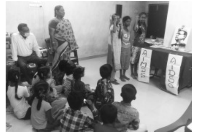
அவியனூர், கடலூர் மாவட்டம்