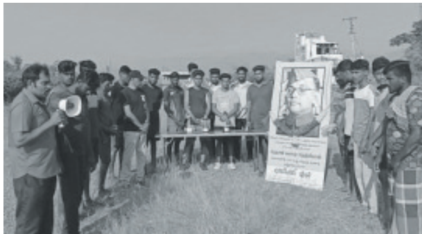
தேனி, காமக்காப்பட்டியில் நேதாஜி நினைவு வாலிபால் போட்டி