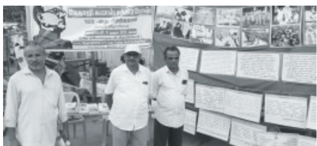
பொன்மொழிக் கண்காட்சி மல்லூர், சேலம்