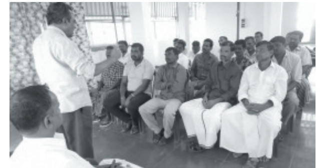
வானூர், விழுப்புரம் ஏறுபடியுசி தொழிற்சங்கம் - பிறந்ததினக்கூட்டம்