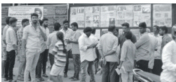
பொன்மொழிக் கண்காட்சி, தேனி