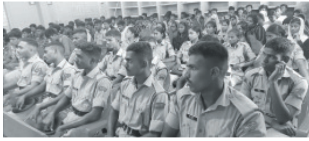
மதுரை வக்ஃபோர்டு கல்லூரி என்சிசி மாணவர்கள் நேதாஜி விழாவில் பங்கேற்பு