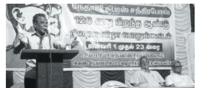
எம் ரெட்டியப்பட்டி, விருதுநகர் மாவட்டம்