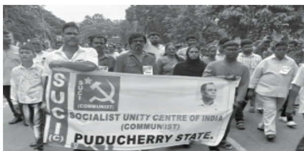
கொல்கத்தாவிலுள்ள பிரிகேட் பேரேட் மைதானத்தை நோக்கி பேரணியாக செல்லும் புதுச்சேரி பிரதிநிதிகள்

இந்தக் கூட்டத்தில் நமது கட்சியில் இல்லாத சாதாரண பொதுமக்களும் இருக்கின்றீர்கள். எங்கள் கட்சித் தோழர்களை நீங்கள் பாராட்டுகின்றீர்கள். எங்கள் கட்சி முற்றிலும் வேறுபட்டது என்கிறீர்கள். இந்த வேறுபாடு எதில் இருக்கின்றது?