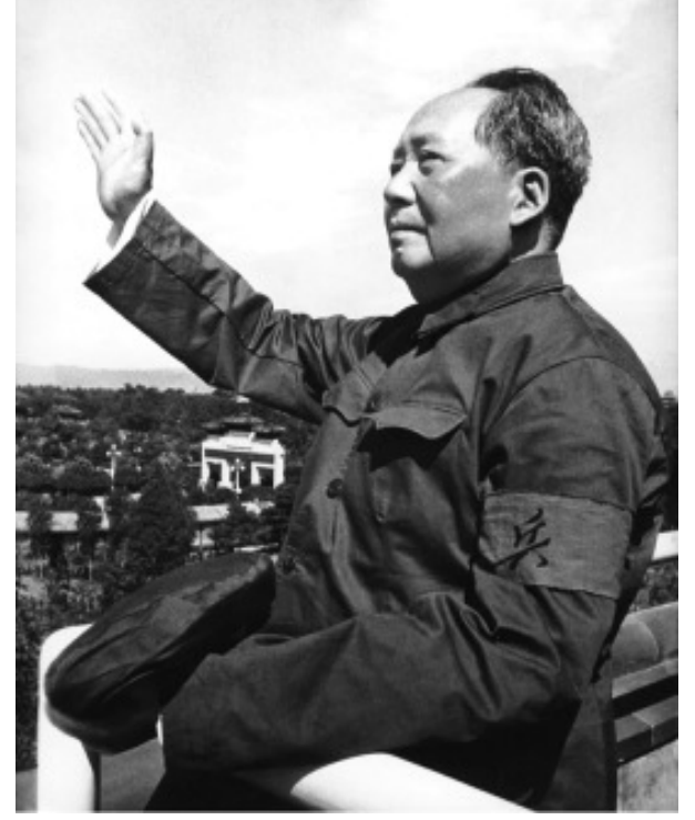
26 டிசம்பர் 1893 - 9 செப்டம்பர் 1976

(மக்கள் மத்தியிலுள்ள முரண்பாடுகளைச் சரியாக கையாள்வது குறித்து)