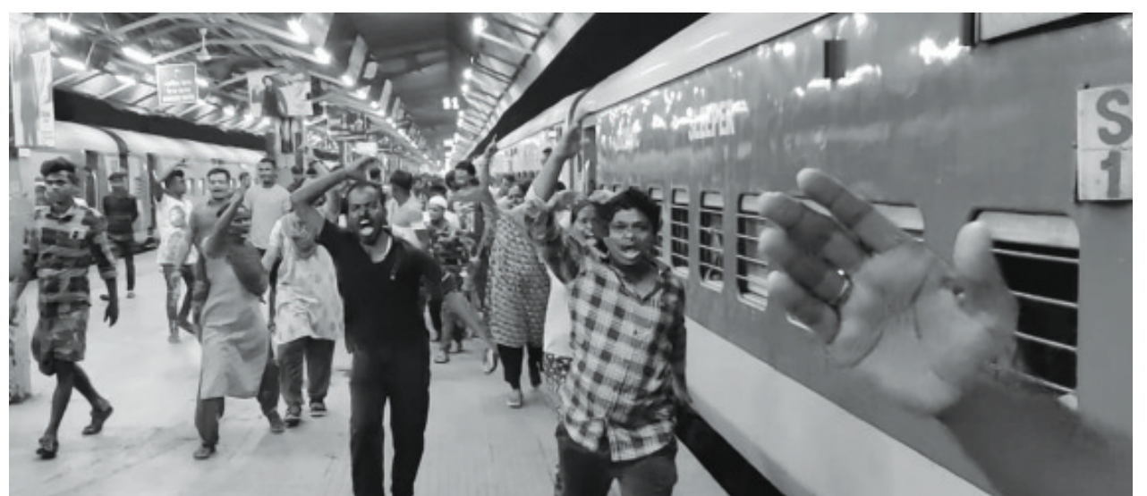
கரக்பூர் இரயில் நிலையத்தில் முன்பதிவு செய்யப்படாத கூடுதல் பெட்டிகள் இணைக்க கோரி இரயில் மறியல்

சமீப வருடங்களாக முன்பதிவு செய்த பயணிகளுக்கும் பதிவு செய்யாத புலம்பெயர் தொழிலாளர்களுக்கும் இடையே, முன்பதிவுப் பெட்டிகளில் அடிக்கடி பிரச்சினைகள் எழுவது இரயில்வே துறைக்குத் தெரியும். ஆயினும் எந்த நடவடிக்கையும் எடுக்கவில்லை. இம்முறை எமது தோழர்கள் துணிந்து கரக்பூரில் இரயில் மறியல் போராட்டத்தில் குதித்ததுடன், உபரி பெட்டிகளை இணைக்கவைக்கும் கோரிக்கையிலும் வெற்றி பெற்றனர். இப்போராட்டத்தில் புலம்பெயர் தொழிலாளர்களும் இறங்கினர். பல்வேறு தமிழக ஊடகங்கள் அக்கணமே செய்தியை சற்றுமுன் வந்த செய்தி எனக் காட்டி ஆளுவோருக்கு நெருக்கடி கொடுத்தன. இது போராட்டத்திற்கு கிடைத்த தற்காலிக வெற்றியாகும். புலம்பெயர் தொழிலாளர்களும் பொதுமக்களும் இணைந்து போராட்டக் களத்தில் இறங்கினால் கீழ்க்கண்ட கோரிக்கைகளுக்கு நிரந்தரத் தீர்வு கிட்டும்.