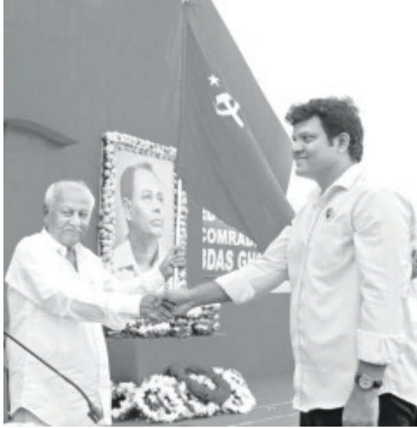
பொதுக்கூட்டத்தில் பங்களாதேஷ் பிரதிநிதி எஸ்யூசிஐ (கம்யூனிஸ்ட்) பொதுச்செயலாளருக்கு நினைவுப் பரிசாக செங்கொடியை வழங்குகிறார்

மூன்றாவதாக, தனிச் சொத்து மட்டுமின்றி, சிந்தனையில் தனிச் சொத்து மனப்பான்மையிலிருந்தும் விடுபட்ட உயர்தர கம்யூனிஸ்ட்டுணைக் கொண்டு ஒரு புரட்சியாளர் குழு உருவாகப்பட வேண்டும். தனிச் சொத்து மனப்பான்மை, சிந்தனை என்பது எனது வீடு, எனது நலன், எனது உணர்வு, எனது விருப்பங்கள், நான் யோசிப்பதே சரி, எனது பெயர், எனது பெருமை, எனது பதவி, எனது கோபம், எனது காதல், எனது நேசம்