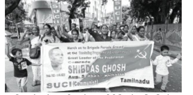
கொல்கத்தாவிலுள்ள பிரிகேட் பேரேட் மைதானத்தை நோக்கி பேரணியாக செல்லும் தமிழ்நாடு பிரதிநிதிகள்

நாங்கள் தேர்தலில் பங்கு பெறுகிறோம். தேர்தல்கள் இருக்கும் வரை மக்கள் அதில் ஈடுபட்டிருக்கும் வரை அரசியல் கருத்தை மக்களுக்கு எடுத்துச் செல்ல நாங்களும் தேர்தலில் பங்கேற்றாக வேண்டும். ஆனால் குறுக்கு