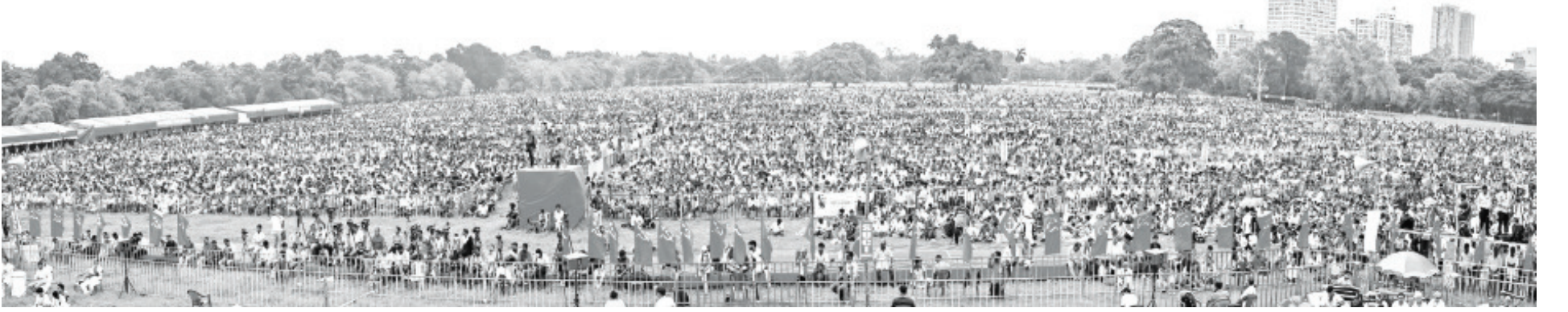
ஆகஸ்ட் 5, கொல்கத்தா பிரிகேட் பேரேட் மைதானத்தில் கூடியிருந்தோர்

இவையாவும் மோசமான முதலாளித்துவ சமுதாயத்தில் இருந்து நமது மனங்களில் புகுந்து விட்டவையாகும். மேலும், நிலப்பிரபுத்துவ சமுதாய சிந்தனைகளும் நம்மிடம் நிலவுகின்றன. எனவே இந்த குணாம்சங்களுடன் ஒருவர்