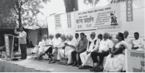
டில்லி ஜந்தர் மந்தரில் ஏஐகேகேஎம்எஸ் சார்பில் நடைபெற்ற தர்ணா போராட்டம்

விவசாயிகள் விரோத கொள்கைகளை மத்திய அரசாங்கம் கைவிட வேண்டும், வேளாண் விளை பொருட்களுக்கு குறைந்தபட்ச ஆதார விலை நிர்ணயம் செய்ய வேண்டும், வேளாண் விளை பொருட்களை அரசாங்கமே கொள்முதல் செய்து விநியோகிக்க வேண்டும், மின்சார திருத்த சட்ட மசோதாவை கைவிட வேண்டும், கிராமப்புற ஏழைகளுக்கு ஆண்டு முழுவதும் வேலை வேண்டும் உள்ளிட்ட கோரிக்கைகளை வலியுறுத்தி நவம்பர் 1 2023 அன்று டில்லி ஜந்தர் மந்தரில் ஏஐகேகேஎம்எஸ் சார்பில் நடைபெற்ற தர்ணா போராட்டம் ■