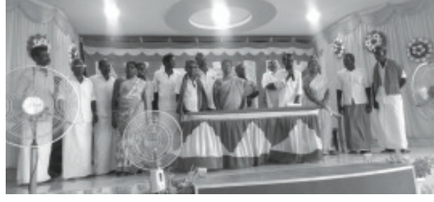
மாநாட்டில் தேர்ந்தெடுக்கப்பட்ட பிரதிநிதிகளுடன் மத்திய, மாநிலத் தலைவர்கள், மாநாட்டில் கலந்துகொண்ட விவசாய விவசாயத் தொழிலாளர்கள்

இத்தகைய நிலையில் புதுக்கோட்டை மாவட்டம் ஆவுடையார் கோயில் வட்டாரத்தில் 2022ஆம் ஆண்டில் மழை பொய்த்து, வறட்சியால் பாதிக்கப்பட்டு, விளைந்தும் விளையாமல்போன நெற்பயிர்களை ஆடுமாடுகளை வைத்து மேயவிடும் நிலைக்கு விவசாயிகள் தள்ளப்பட்டனர். இதற்காக இப்பகுதி விவசாயிகள் கிராமம் கிராமமாக வாகனப் பிரச்சாரம், தர்ணா போராட்டம் மற்றும் சம்மந்தப்பட்ட அதிகாரிகளிடம் முறையிடுதல் உள்ளிட்ட துறை ரீதியிலான நடவடிக்கைகளை மேற்கொண்டனர். ஆயினும், வறட்சி நிவாரணமும் பயிர்க்காப்பீட்டுத் தொகையும் சரிவரக்கிடைக்கவில்லை.