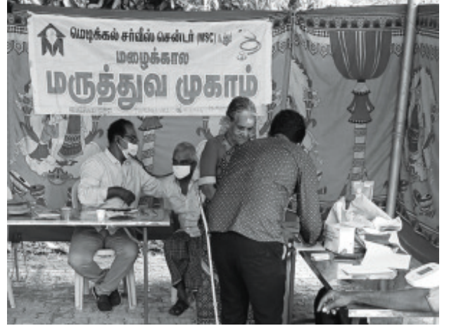
அண்ணா நகர் மீனாட்சிபுரம் திருநெல்வேலி மாவட்டம்

நெல்லை நகரில் ஆற்றங்கரையோர வீடுகள் முதல் மாடி கூரைவரை மூழ்கியதால் மக்கள் அனைத்துப் பொருட்களையும் இழந்து கடும் சோகத்தில் இருந்தனர். ஆயினும், மருத்துவக் குழுவை வரவேற்று முகாம் அமைக்க அனைத்து உதவிகளையும் நல்கினர். பிருந்தாவன் கட்டுமான நிறுவன தொண்டர்கள் வாகன பிரச்சாரம் செய்தனர். சிந்துப்பூந்துறையில் முதல் நாள் முகாம் இரண்டாம் நாளும் தொடர வேண்டியுதாயிற்று. அரசாங்கத்தின் கண்துடைப்பு முகாமிற்கும் இந்த முகாமிற்கும் வேறுபாட்டை உணர்ந்த மக்கள் தொடர்ந்து அணுகி பயன்பெற்றனர். பின்பு, கலெக்டர் அலுவலகத்தையே மூழ்கடித்த கொக்கரகுளம் பகுதியில் ஸ்டெல்லா மேரிஸ் பாலர் பள்ளியில் நடைபெற்ற முகாமிலும் முழு நாளும் மக்கள் பயன் பெற்றனர். அடுத்த நாள், அண்ணா நகரில் நடைபெற்ற முகாமிற்கு அப்பகுதி மக்கள் ஒத்துழைத்து பயன்பெற்றனர். முகாம்களில் மெடிகல் சர்வீஸ் சென்ட்ரல் அகில இந்திய செயற்குழு உறுப்பினர் டாக்டர்