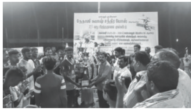
காமக்காப்பட்டி, தேனி மாவட்டம்