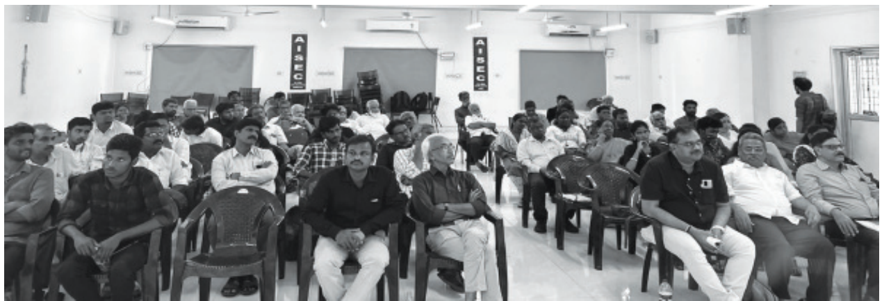
சென்னையில் கல்விப் பாதுகாப்பு மாநில மாநாட்டில் கலந்துகொண்டோர்