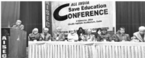
புதுதில்லியில் நடைபெற்ற அகில இந்திய கல்வி பாதுகாப்பு மாநாட்டில் கலந்துகொண்ட தலைவர்கள்