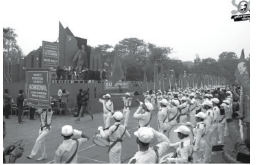
கொல்கத்தாவில் நடைபெற்ற மாபெரும் லெனின் அவர்களின் நினைவு நூற்றாண்டு பொதுக்கூட்டம்