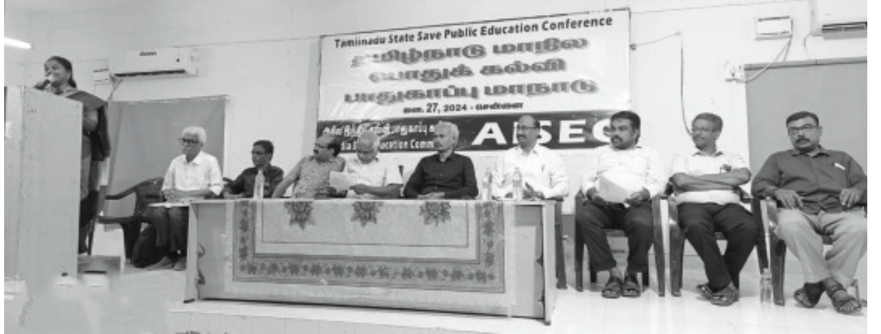
சென்னையில் கல்விப் பாதுகாப்பு மாநில மாநாட்டில் மாநில தலைவர்கள்