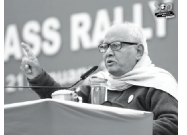
கொல்கத்தாவில் நடைபெற்ற பொதுக்கூட்டத்தில் எஸ்யூசிஐ (கம்யூனிஸ்ட்) கட்சியின் பொதுச் செயலாளர் தோழர் பிரவாஸ் கோஷ் உரை

கூட்டத்தில் அலைகடலென பங்கேற்ற மக்கள் திரள்