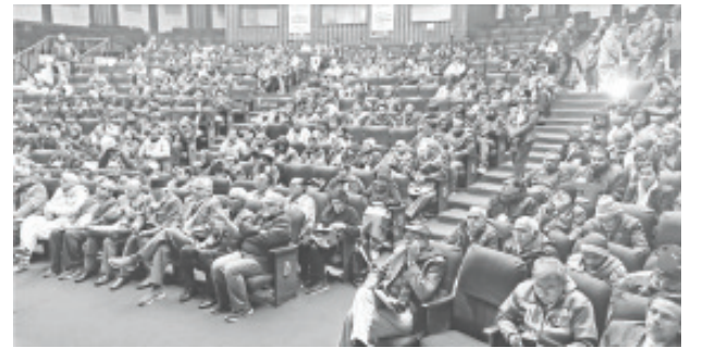
புதுதில்லியில் அகில இந்திய கல்விப் பாதுகாப்பு மாநாட்டில் கலந்துகொண்டோர்