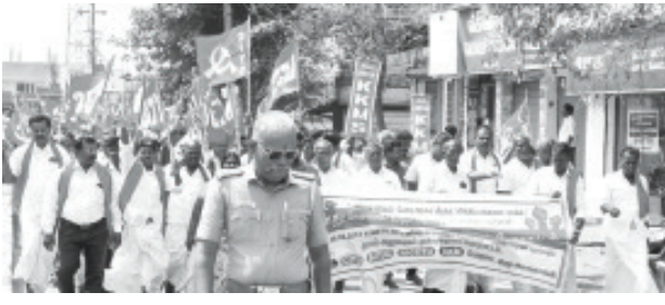
அறந்தாங்கி, புதுக்கோட்டை மாவட்டம்

கடந்த 10 ஆண்டுகளாக மத்தியில் ஆட்சியில் இருக்கும் பாஜக அரசாங்கம் மக்கள் விரோத நடவடிக்கைகளையும் தொழிலாளர்கள் விவசாயிகள் மீதான மசோதாக்கள் மற்றும் தாக்குதல்களையும் தொடுத்து வருகின்றது.