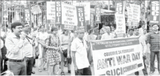
கொல்கத்தா, மேற்கு வங்கம்