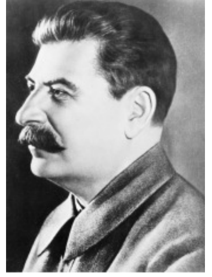
18 டிசம்பர் 1878 - 5 மார்ச் 1953

(மூலதனம் தொகுதி 3, பகுதி 3, அத்தியாயம் 5)