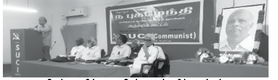
சென்னையில் நடைபெற்ற அஞ்சலிக் கூட்டம்