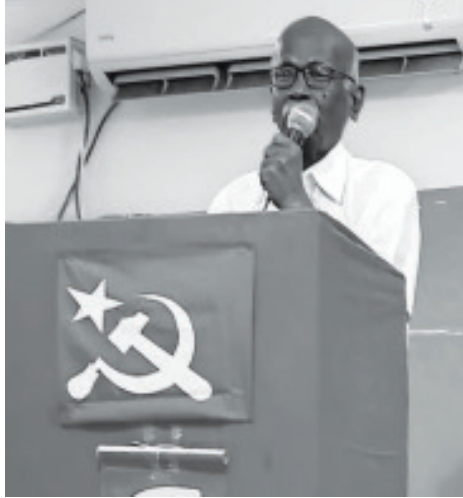
மாநிலச் செயலாளர் தோழர் ரெங்கசாமி உரை